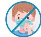
착용중 마스크 만지지 않기 만진 후 깨끗이 손씻기