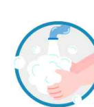
마스크 착용 전 깨끗이 손 씻기