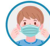
입과 코를 가리고, 틈이 없도록 착용