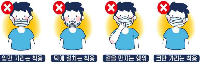
입만 가리는 착용 턱에 걸치는 착용 걸을 만지는 행위 코만 가리는 착용